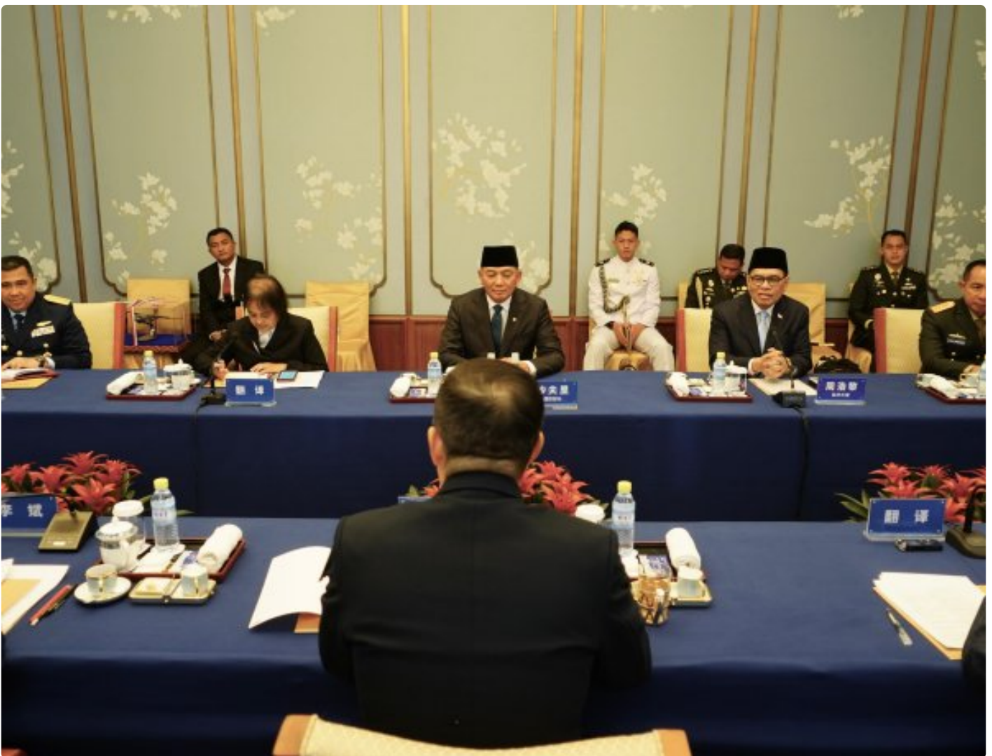
RRT - Panglima TNI Jenderal TNI Agus Subiyanto mendampingi Menteri